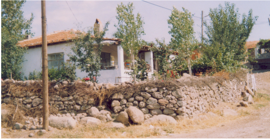
Fotoğraf 3. Kocaören Köyünde taş parçalarının üst üste yığılması ve üzerine kuru çalıların sıralandığı bir avlu duvarı.

Şehre uzak dağ-tepelik alan köylerinde avlu duvarı, öncelikle genel veya ortak mekan ile özel mekan arasındaki sınırdır. Böylece, geleneksel toplum yapısı içinde insanların ve hayvanların rast gele özel mekana girişi engellenir. Bu köylerde, eğer avlu duvarı biraz yüksekse (ki çoğunlukla 1 metreyi biraz aşar ve çoğunlukla taşların üzerine bir sıra kuru çalı dizilerek yükseltilir), bu durum hayvanların avludaki ekili alanlara girip zarar vermesini önlemek içindir (Fotoğraf 3). Avlu duvarı, sembolik olarak özel mekan ile genel/ortak mekan arasındaki eşiktir . Dağlık-tepelik alan köylerinde nüfus az olduğu için çoğunlukla arazi sıkıntısı yoktur ve evin önündeki avlu oldukça geniştir. Böylece eşik (avlu duvarı) evin ön cephesinin oldukça uzağında yer alır ve bu şekilde ayrıca göz ve ses mahremiyeti sağlanmış olur (Fotoğraf 2).