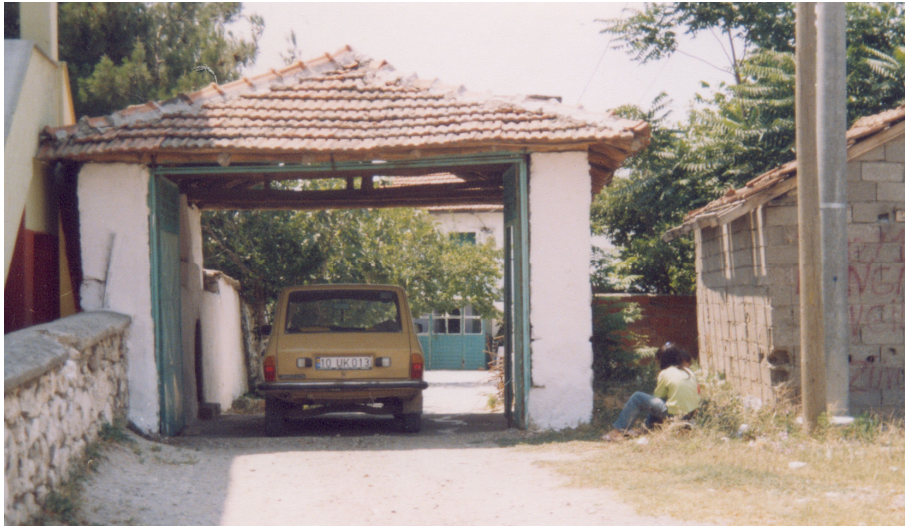
Fotoğraf 5. Çağış köyünde yüksek duvarlarla dışarıdan tecrit edilen bir evin giriş kapısı.

kullanılmıştır. Bu yapı malzemelerinin de katkısıyla avlu duvarları daha ince, fakat yüksek ve sağlamdır. Bazen görsel olarak daha hoş bir mekan yaratmak için duvarlar sıvanmış ve boyanmıştır (Fotoğraf 1 ve 4). Balıkesir ovası köylerinde günümüzde sıkça rastlanmaya başlanan şehrsel merkezlerdeki apartmanlara benzer iki/üç katlı evlerin avlu duvarları ise, sözünü ettiğimiz kırsal peyzajdan tamamen farklıdır. Şehir evlerinin olduğu gibi kopya edildiği bu evlerin avlu duvarları, ova köylerindeki geleneksel kırsal evlerin avlu duvarlarından farklı olarak alçak, sıvalı ve boyalı, süslemelidir.