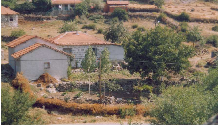
Fotoğraf 2. Kocaören Köyü'nde ev ve avluların taş yığınları ve kuru çalılarla çevrelendiği bir kırsal peyzaj.

Balıkesir ovası köyleri ile çevredeki dağlık-tepelik alan köylerindeki avlu duvarları arasındaki en belirgin farklılık, yükseklikleridir. Şehre yakın kırsal yerleşmelerde avlu duvarları çok yüksektir; çoğunlukla bir insan boyunu aşacak şekilde inşa edilmiştir ve bazen 2 metrenin üzerine çıkar (Fotoğraf 1 ve 4). Şehre uzak dağlık-tepelik alan köylerindeki bütün evlerin avlusu ve avlu duvarı olmakla birlikte, avlu duvarı çok alçaktır. Genellikle 1 metreyi aşmaz. Yoldan bakıldığında avlunun içi ve evin önü kolayca görülebilir; avlu duvarı insanların içeri girmesini engelleyecek fiziki engel özelliği göstermez (Fotoğraf 2).